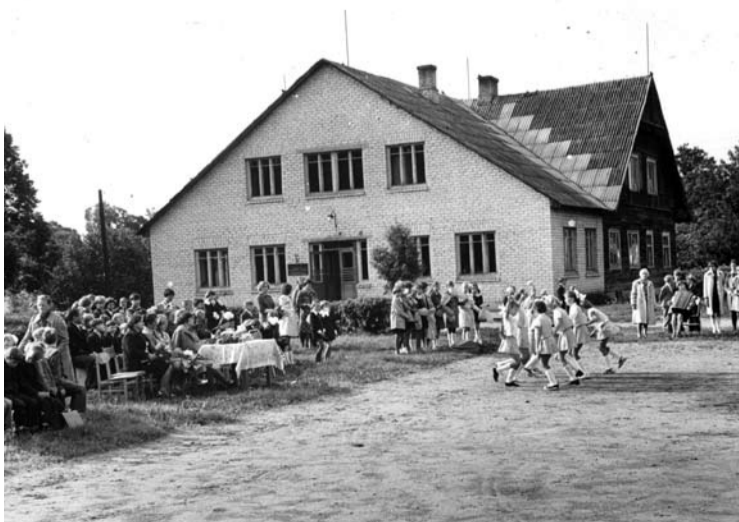
Rugsėjo 1 – osios šventė Žaliosios aštuonmetės mokyklos kiemelyje.

Knyga iliustruota didžiuliu pluoštu, jų bene 125, fotografijų. Dauguma jų unikalios, spausdinamos pirmą kartą, tiesiog švytinčios ypatinga jaunatviška nuotaika, išgyventą laiką liudijančios subtiliomis detalėmis. Visko nesurašysi, nesuminėsi - reikia imti ir skaityti Žaliosios knyga.