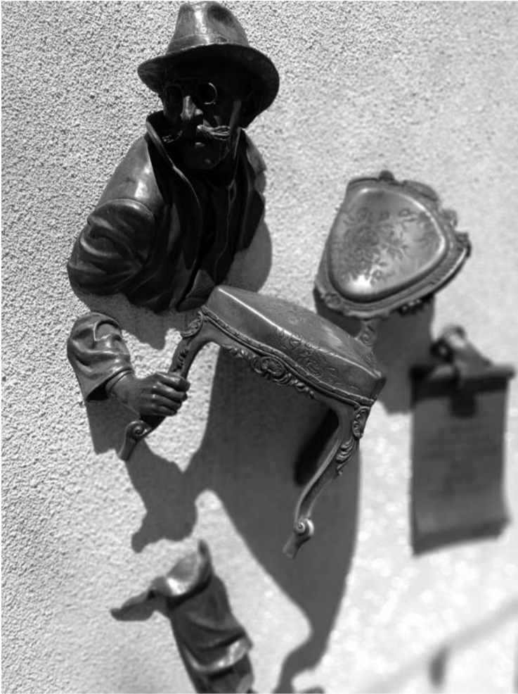
Filmo „12 kėdžių“ herojui Kisai Vorobjaninoviui skirta kompozicija.

Todėl nenustebčiau, jei šiems žmonėms klausimas, kas sieja karą Ukrainoje su kino komedija „12 kėdžių“ iš pirmo žvilgsnio gali pasirodyti kvailas ir visiškai nei į tvorą, nei į mieta.