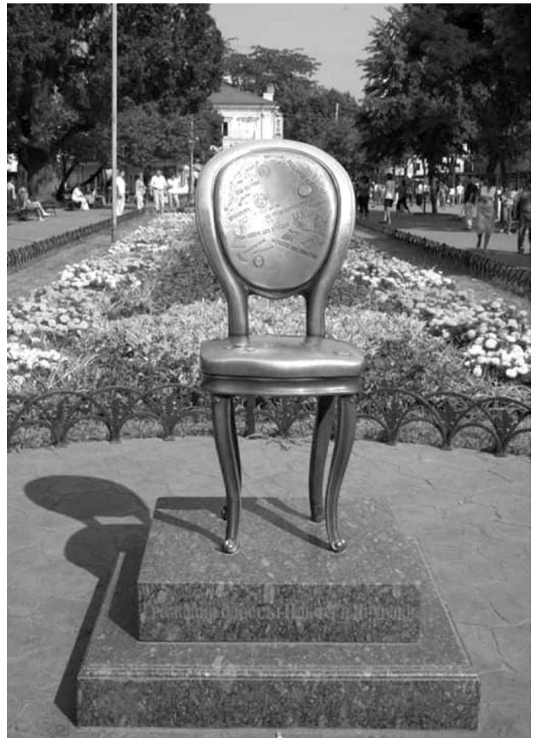
Kėdė iš filmo „Dvylika kėdžių“. Manoma, kad ji iš centrinio Odesos sodo bus perkelta į privatų muziejų ar menininkų namus.